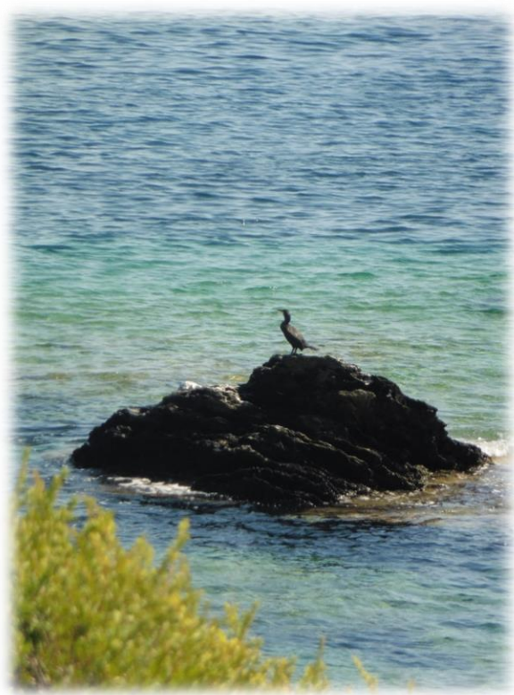
Aan de baai van Santa Maria is er nog een mooie ruïne van een Genuese toren. Een aalscholver rust even uit op een naburige rots in de zee.