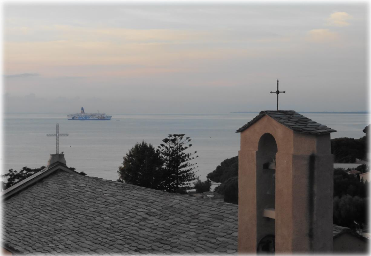
Beide bovenstaande foto's zijn genomen van op het terras van ons appartement.