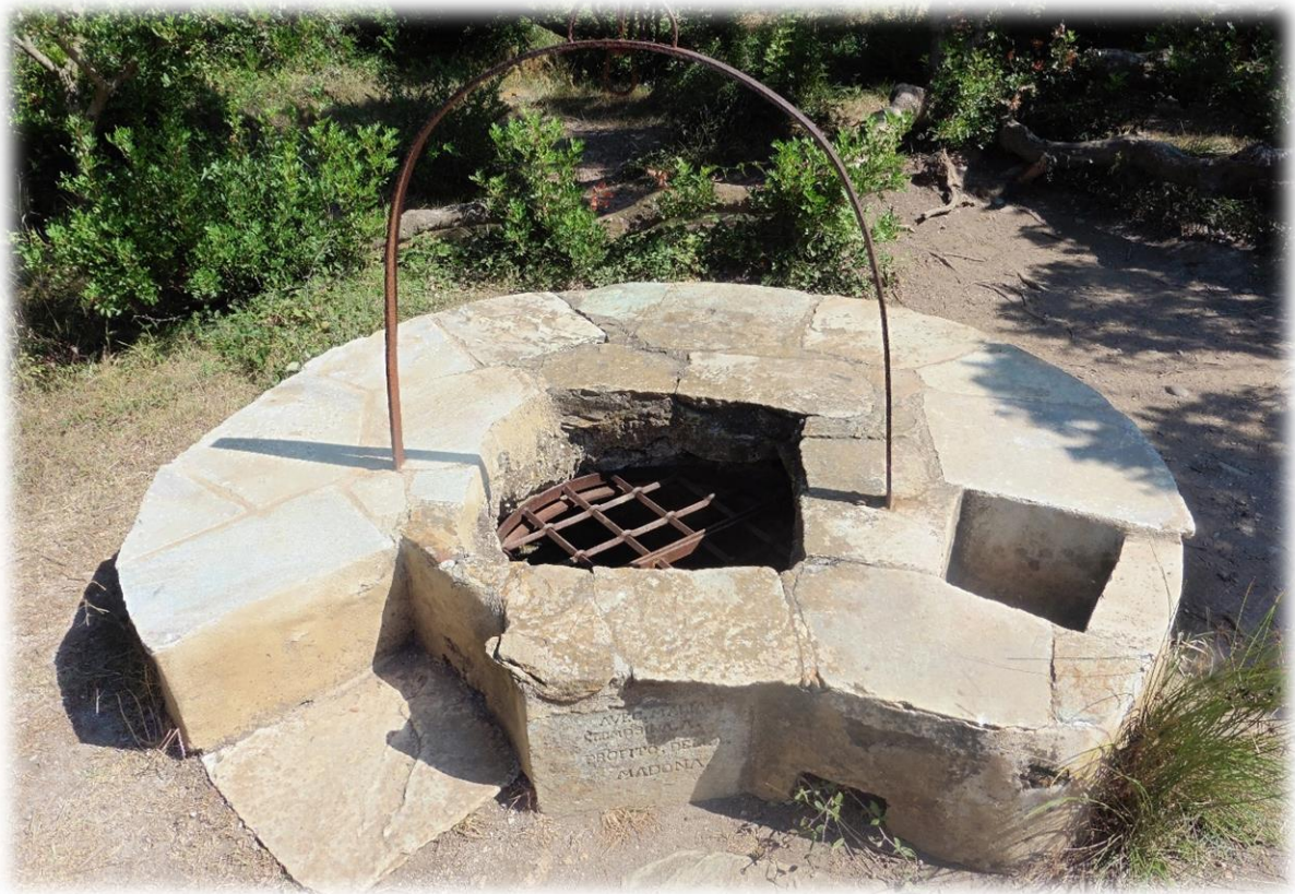
De kapel van Santa Maria is in de 12e eeuw gebouwd op de resten van een christelijke kerk.