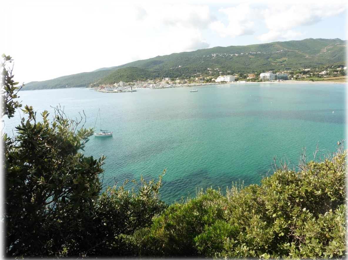
Op het pad zie je jeneverbessen, mastiekbomen en affodillen.