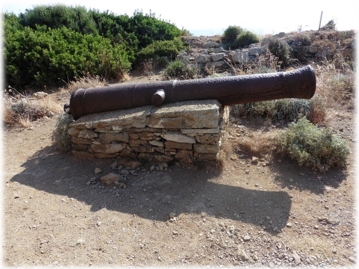
Een oud kanon ligt langsheen het pad. Er zijn veel wandelaars op het pad van de douaniers. Het is dan ook een zeer gekend wandelpad.